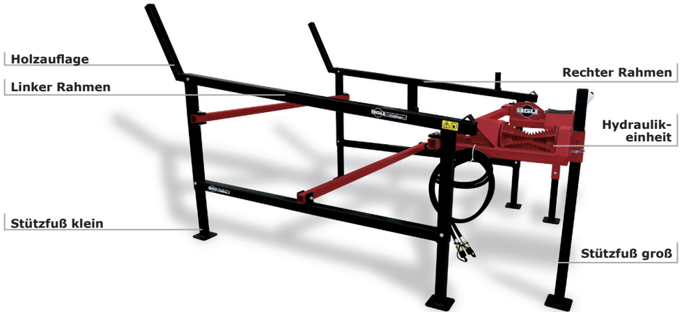
Holzzuführbock HZB 3000 HL